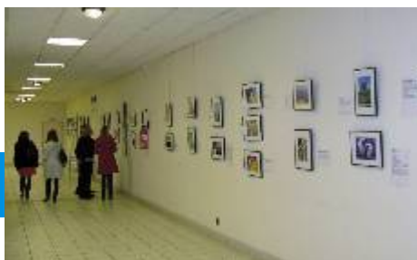
L'ensemble des 40 cadres et témoignages.