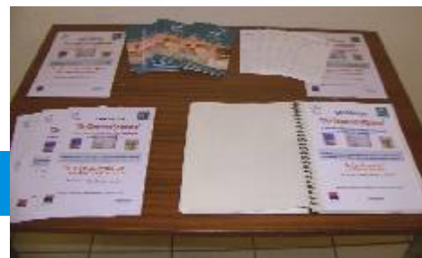
Flyers et livre d'or de l'exposition.