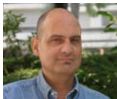
Par Guy Bouguet, Président de France Lymphome Espoir