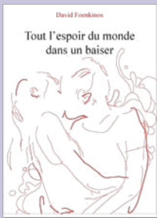
Couverture: Seb Jarnot

"C'est sûr qu'au tout début, on pense toujours à des choses simples. On pense que la maladie, c'est pour les autres. Un peu comme les accidents de voiture. Alors ces ganglions, c'était juste un petit rien qu'on enlèverait facilement, une routine de la médecine. Seulement voilà, le docteur ne parlerait pas de glace. Ni vanille ni fraise. On serait même assez loin de tous les parfums."